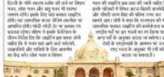
रात में जागमग रहेगा विद्यान भवन और लोकभवन

भक्ति जात पात नहीं देखती। मुख्यमंत्री योगी अतिव्यवस्था ने मंगूरा के श्रीजी मंदिर में तैयार करने को पूजा की।