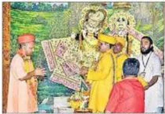
सीएम योगी ने बजटार को मंगूरा के श्रीजी मंदिर में तैयार करने को पूजा की।

लखनऊ, प्रमुख संघर्षदाता। मुख्यमंत्री योगी अतिव्यवस्था में लखनऊ के कुकरैल वन में नाइट सफारी विकसित किए जाने के निर्देश दिए हैं। उन्होंने कहा है कि जंगल को नुकसान पहुंचाए बिना यह सफारी विकसित की जानी चाहिए।