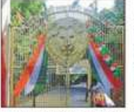
Lucknow's zoological park was established on November 29, 1921 by then Governor, Uttar Pradesh, Sir Spencer Harcourt Butler.

The move is aimed at decongesting the overcrowded Narhi area because of the presence of the zoological garden. The state government is yet to take a call on the use of land in Narhi area, from where the zoo would be shifted. According to the cabinet decision, a night safari will come